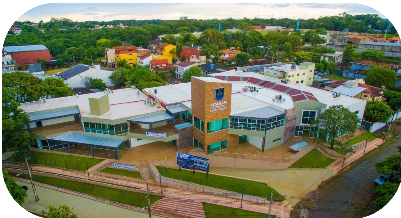
Universidad UNIDA - Campus Ciudad Del Este